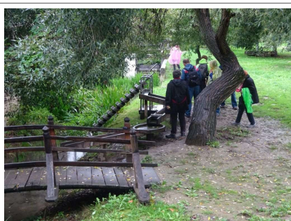
A malomsziget vízjátéka