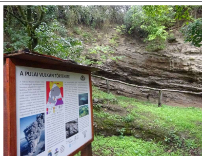
Káter Kőpark tanösvény