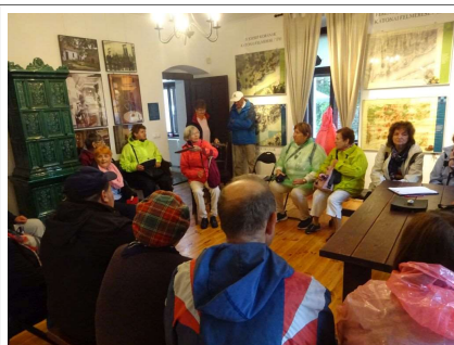
Ili néni hallgatva a molnárházban

A séta után elfogyasztottuk ebédünket a Falumalom udvarán, majd meglátogattuk az egykori Kúthy kúriát, melynek földszintjén a felújítás után kávézót alakítottak ki.