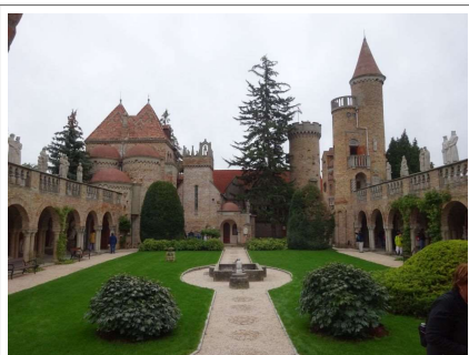
A Százoszlopos udvar

Elmondhattuk, hogy egy tartalmas nap után indultunk haza.