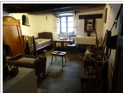
A kovácsműhely lakóháza