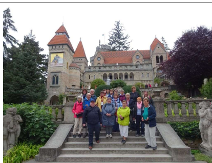
A csoport a főlépcsőn