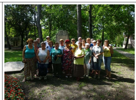
A csoport az I. Valentinianus emlékműnél