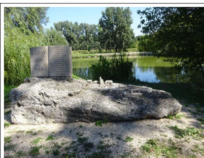
Kórház-tó, Kállay Ödön park