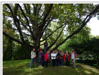
A kert egy idős tölgyfájánál

Ezt követően újabb sétára indultunk. Először az épülettel szemközti kis tónál csodáltuk meg az épp nyíló vízitököket. Majd útba ejtettük a NöDiK magtárát, megtudtuk, hogy a padlásán macskabagoly talált otthonra, neve MAGdi. Az ültetvények felé vettük az irányt, ahol a gyűjtemények felszaporítása, felújító vetése zajlik. Elhaladtunk az intézet nőszirm gyűjteménye mellett melyek tavasszal teszik látványossá ezt a területet. Végül működés közben láthattuk a szárítókamrát, bepillantottunk a 0, és a -20 C°-os tárolókba is, majd visszasétáltunk a kiinduló pontra, ahol elköszöntünk vezetőnkől.