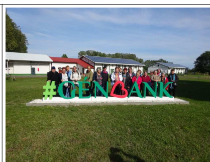
Mögöttünk a fagyasztók

Magunk mögött hagytuk a Központ közel 300 hektáros zöld területét és kirándulásunk utolsó állomása, a tápiszelei Blaskovich Múzeum - az ország egyetlen, a második világháborút berendezésében is sértetlenül átvészelő Kúriamúzeuma - felé indultunk.