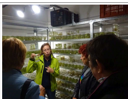
Vezetőnkkel a csíráztatóban