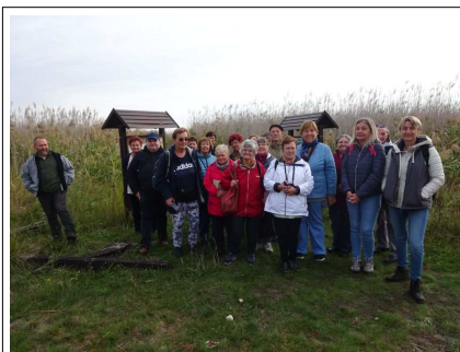
A csoport DINPI vezetőnkkel

Megköszönve kísérőnk rendkívül élvezetes ismertetését folytattuk utunkat Tápiószele felé.